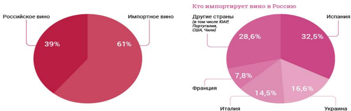
Рисунок 2. Соотношение вина и винопродуктов – российских и импортных

Согласно Концепции развития виноградарства и виноделия, разработанной Минсельхозом, достичь его Россия сможет к 2025 году.