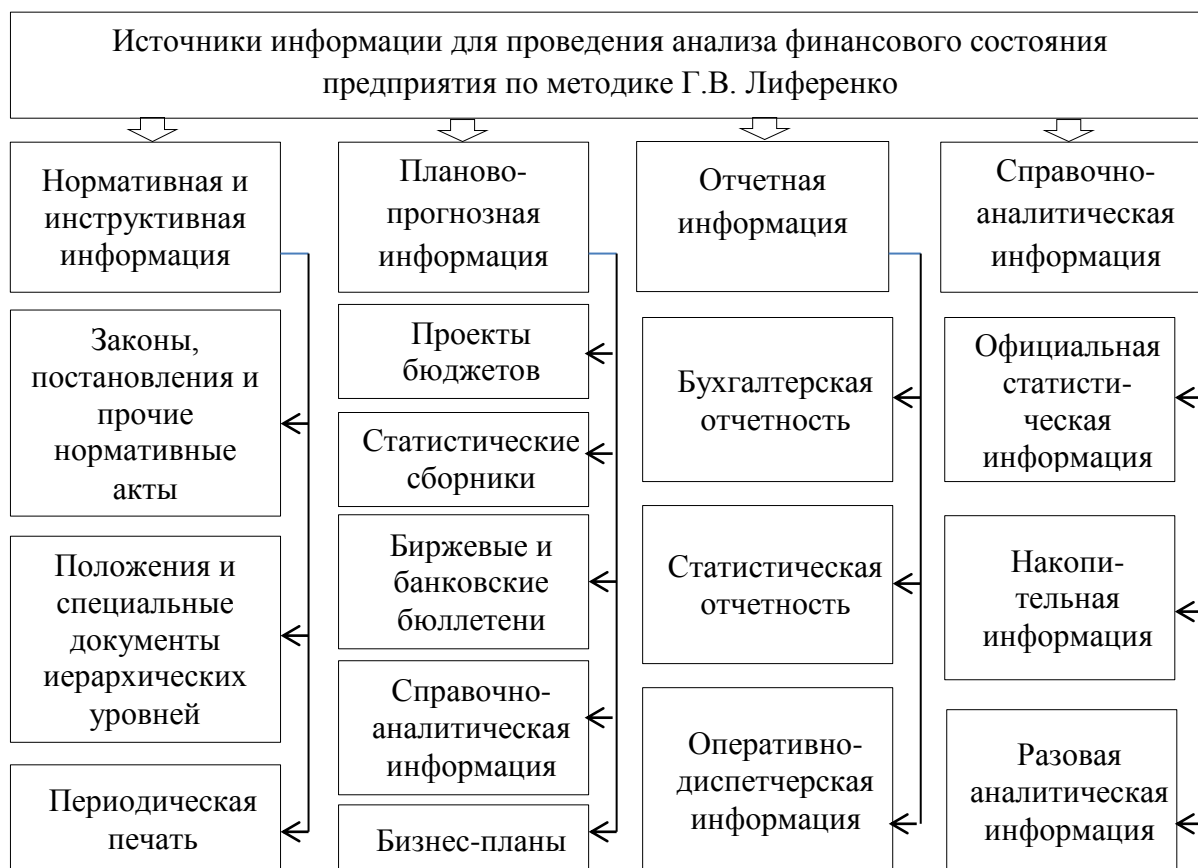
Рисунок 3. Источники информации для проведения анализа финансового состояния предприятия по методике Г.В. Лиференко