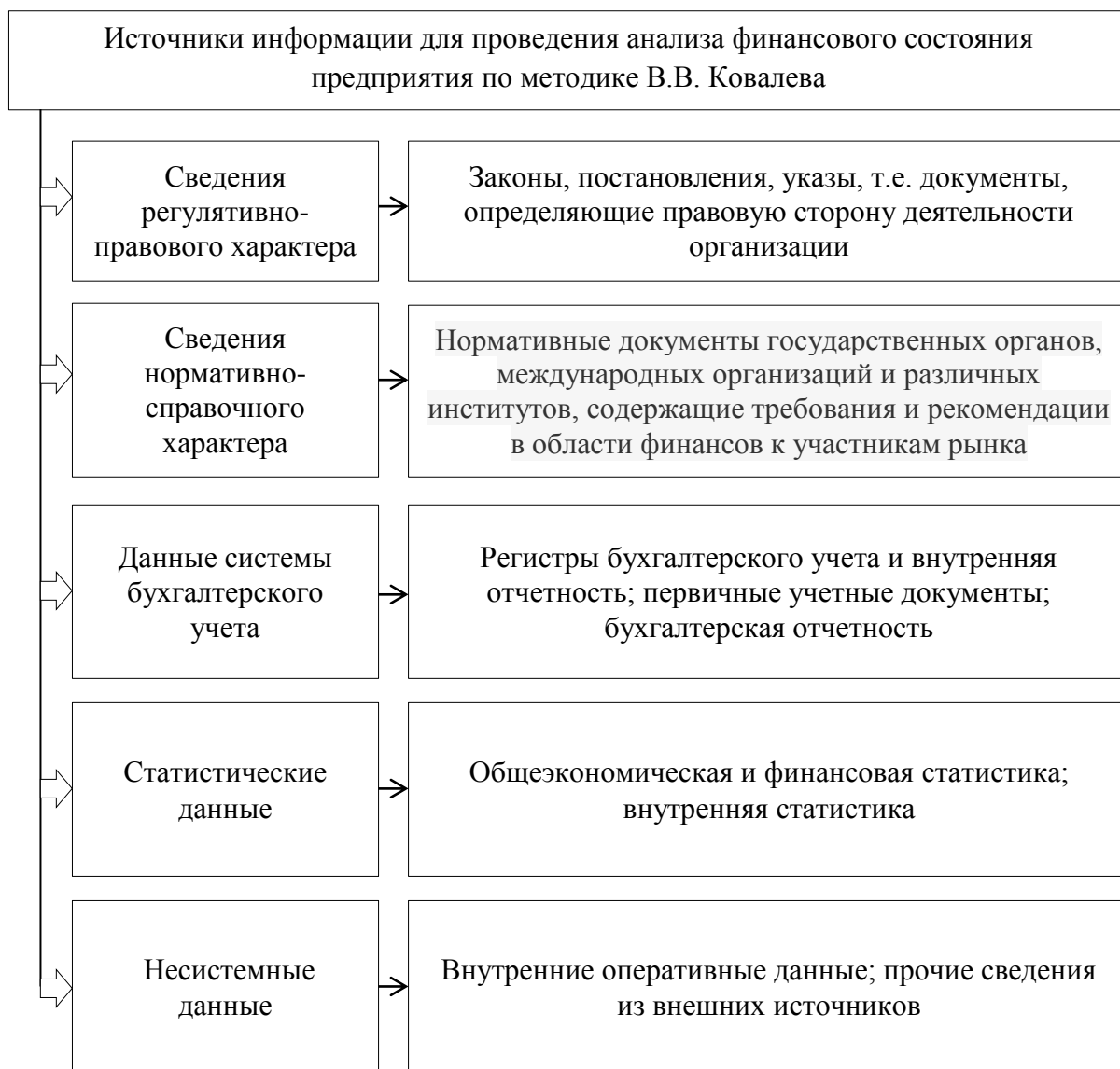
Рисунок 4. Источники информации для проведения анализа финансового состояния предприятия по методике В.В. Ковалева

Информационный поток имеет обратную связь с производственным процессом, путем сравнения полученных результатов с прогнозными значениями и планирование мероприятий по улучшению показателей производственно - финансовой деятельности предприятия.